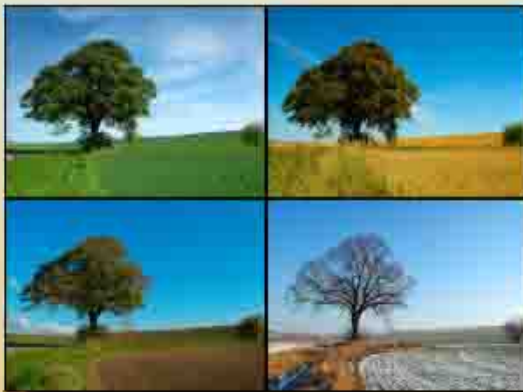
Las Cuatro Estaciones

Trapos es un espectáculo donde la naturaleza tiene mucha importancia. A lo largo de su viaje Trapo tiene relación con muchos personajes: la luna, el viento, el río. Pasa por el bosque y sube la montaña. Las estaciones de el año están muy presentes. Os proponemos un estudio sobre las fases, las estaciones y los ciclos de todos estos elementos de la naturaleza: