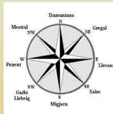
La Rosa de los Vientos